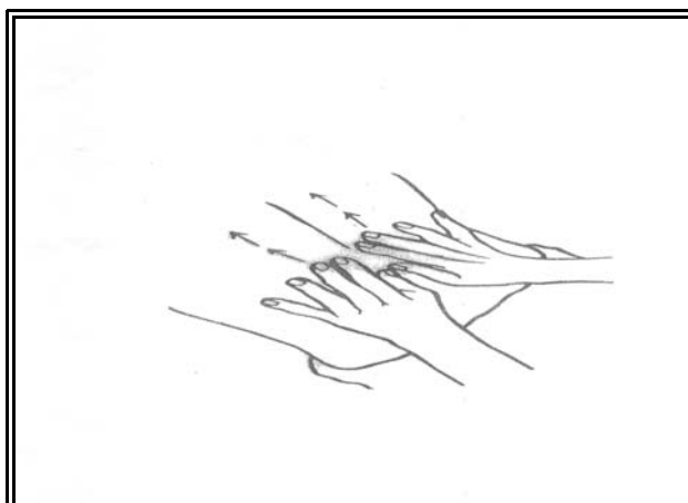
تصویر شماره ۱- نحوه انجام ماساژ به طریقه افلوراج

در طی افلوراج فشار آرام بر پوست وارد شده و این فشار به میزان متوسط به لایه زیرجلدی منتقل می‌شود. فشار در طی این روش آنقدر عمیق نیست که نسوج زیرین را تحت تأثیر قرار دهد. کیفیت فشار، سرعت و ریتم آن ممکن است باعث ایجاد اثرات مختلفی بشود. برای مثال وقتی افلوراج با فشار متوسط، آهسته و آرام در پشت انجام شود، می‌تواند سیستم پاراسمپاتیک را تحریک نماید و پاسخ آرام‌سازی ایجاد شود و وقتی فشار متوسط تا عمیق باشد می‌تواند باعث افزایش بازگشت وریدی در اندام‌ها شود [۲۱،۲۲].